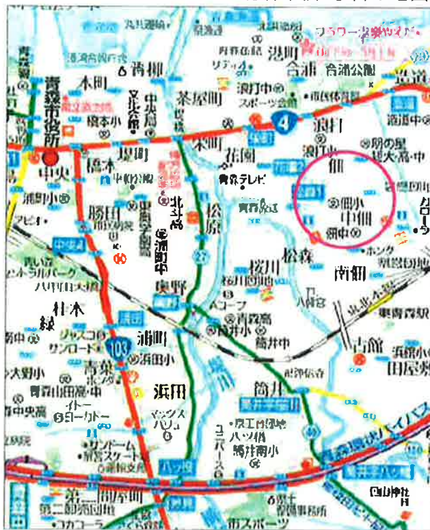
青森市佃2丁目の地図