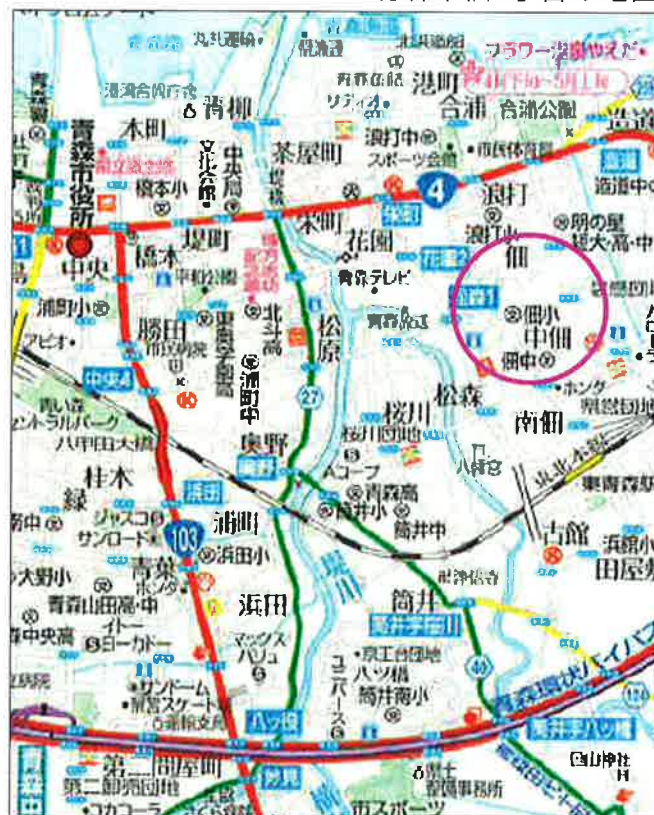
青森市佃2丁目の地図